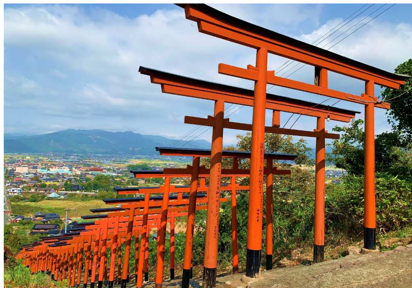
福岡県うきは市の山の中腹に建つ浮羽稲荷神社の赤い鳥居